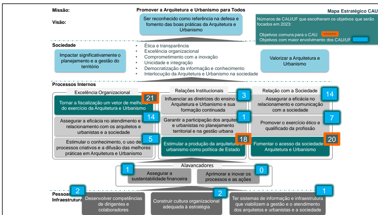
Figura 1. Mapa Estratégico do CAU

Em 2023 o CAU mantém como uma de suas prioridades as ações voltadas para a atuação da profissão junto às classes menos favorecidas, com ações implementadas por meio de iniciativas estratégicas em Assistência Técnica em Habitações de Interesse Social ATHIS , considerando aspectos relevantes para a melhoria da qualidade de vida da população, em acordo com a Resolução CAU/BR nº 94, de 07 de novembro de 2014, e os princípios da Lei nº 11.888/2008.